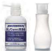
おしりまわり 希釈ボトル 洗浄液

天然ひまわり由来の石鹼 で汚れを優しく落とします ※天然由来成分なので すすぎは不要